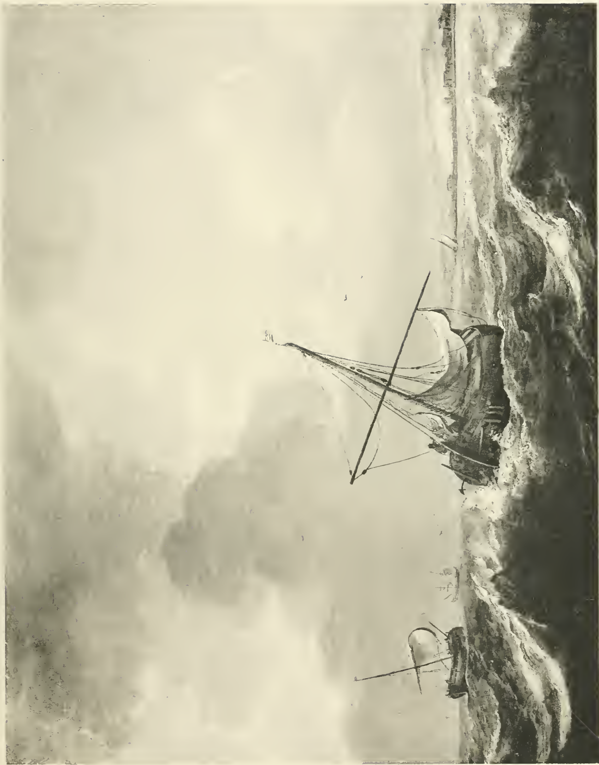
A. VAN BEYEREN